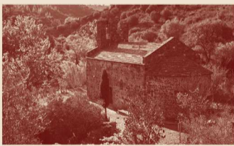
Dissabte, 16.11.24 Sant Silvestre de Valleta