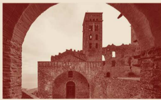
Dissabte, 09.11.24 Conjunt monumental de Sant Pere de Rodes