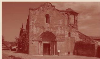
Dissabte, 23.11.24 Priorat de Masarac