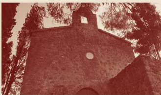
Dissabte, 30.11.24 Monestir de Santa Maria del Mar de Calonge (El Collet de Sant Antoni)