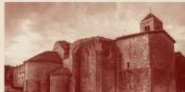
Dissabte, 18.11.23 Canònica de Santa Maria de Vilabertran Els banquets medievals i els seus vins