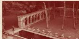
Dissabte, 25.11.23 Mas del Vent (Palamós) Vins heretges i falses certeses

VISITA GUIADA I TAST DE VINS Hora: 12 del migdia Durada: 2 hores aproximadament