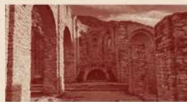
Dissabte, 11.11.23 Monestir de Sant Llorenç de Sous (Albanyà) Vinyes i Vins de Muntanya