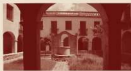
Dissabte, 04.11.23 Convent de Sant Bartomeu de Bell-lloc a Peralada Les monges de l'Albera i el vi